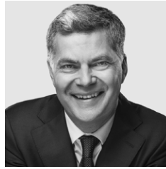
Mario Dumont Animateur LCN Chroniqueur Journal de Québec et Journal de Montréal