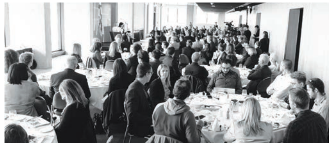
POINT DE VUE Valérie Plante, mairesse de Montréal | 4 mai 2018