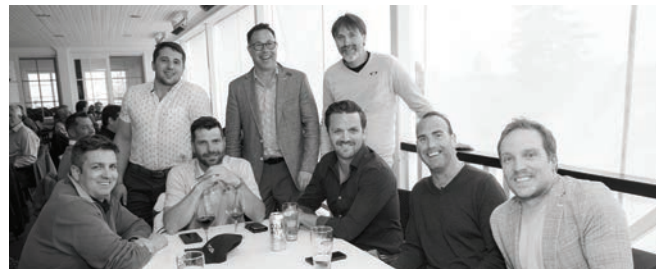
CLASSIQUE DU PRÉSIDENT 4 juin 2018